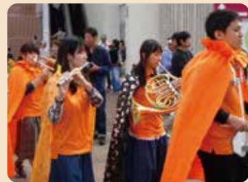
昨年度ハロウィンパレードの様子