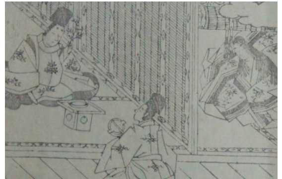
嵯峨本『伊勢物語』（花橋の香をかげば）

このように絵という素材は、豊かな世界を垣間見せてくれる窓のようなものです。なお展示した本学の資料のうち、お伽草子については、画像を公開しています。本学図書館のホームページで「コレクション」の項目をクリックし、見たい作品を選べば、閲覧可能です。こうした画像を公開している大学は、実は多くありません。機会があれば、ぜひそれらの資料を見てみてください。