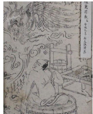
『晒落模様飛羽衣』（『黄表紙佳作品十種合本』のうち） （天から落ちた天女）