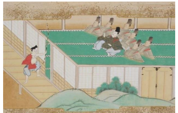
『依藤太絵巻』（不死身の将門討伐）