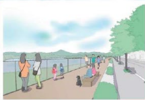
＊西側堤防～三角公園